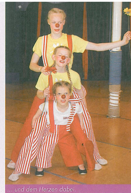
... und dem Herzen dabei.

Allen Beteiligten müssen die Anstrengungen bewusst sein, die bei der Teilnahme am Circus UBUNTU auf sie zukommen. Man lebt ja wirklich ein Jahr lang für den Zirkus. Das bedeutet, dass die gesamte Freizeit der Mitreisenden dem Zirkus gehört. Dazu zählen auch alle Wochenenden und Feiertage. Deshalb ist UBUNTU immer eine Familienentscheidung. Da müssen alle Beteiligten wirklich mit dem ganzen Herzen dabei sein!